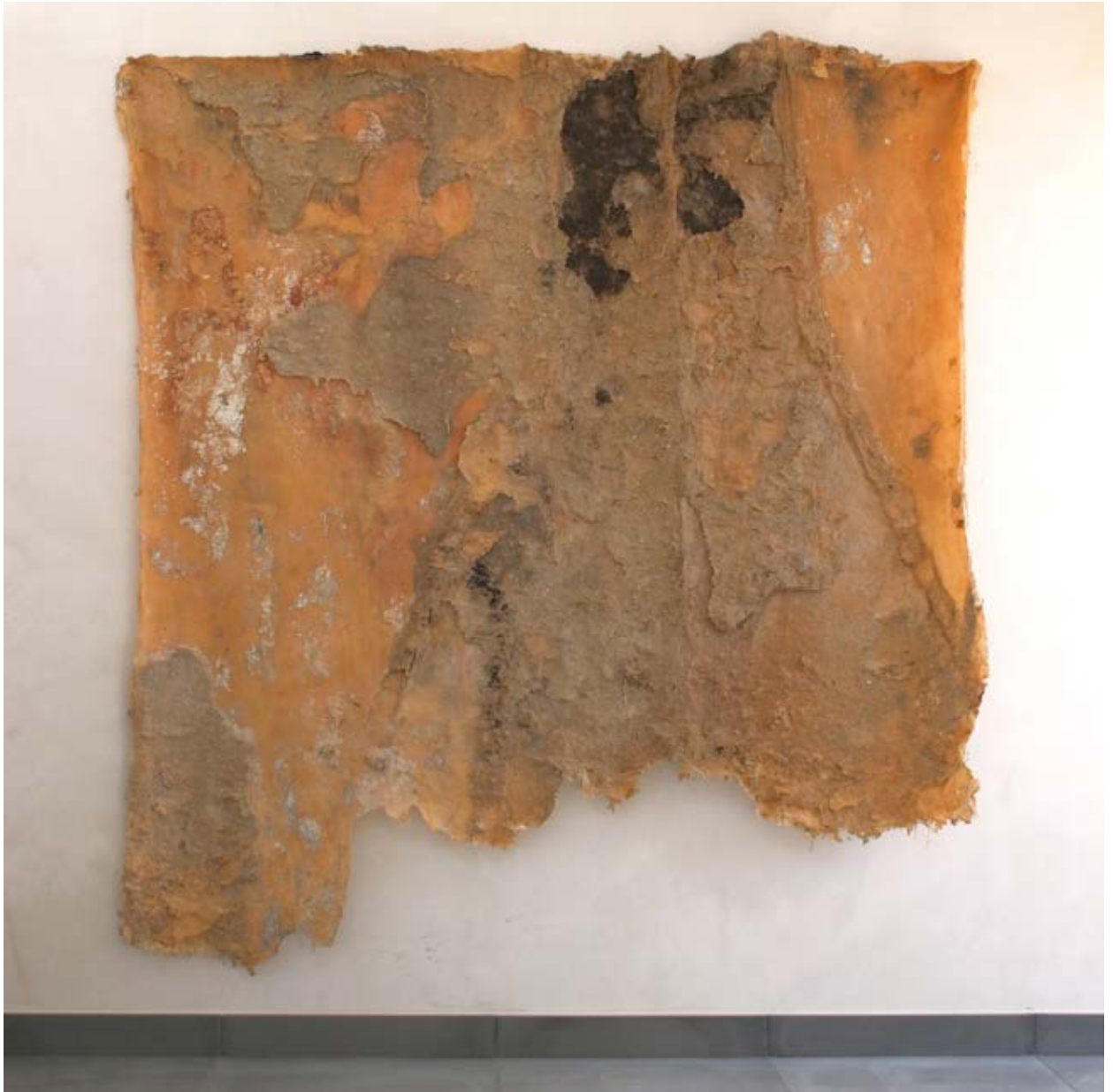
Projecte Retornar/ Llar. Làtex, gassa de cotó i restes de paret. 180 x 180 cm. Motlle de la cantonada de paret on hi havia la llar de foc del mas Gasoses