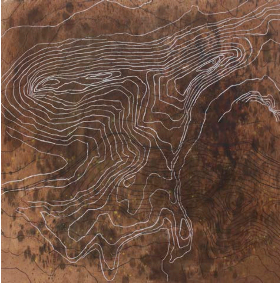
Sèrie Estrats, 4. Òxit, nogalina i pastel gras sobre fusta. 120 x 120 cm.