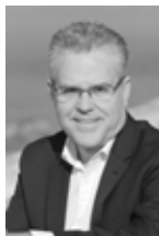
Pere Granados Alcalde de Salou