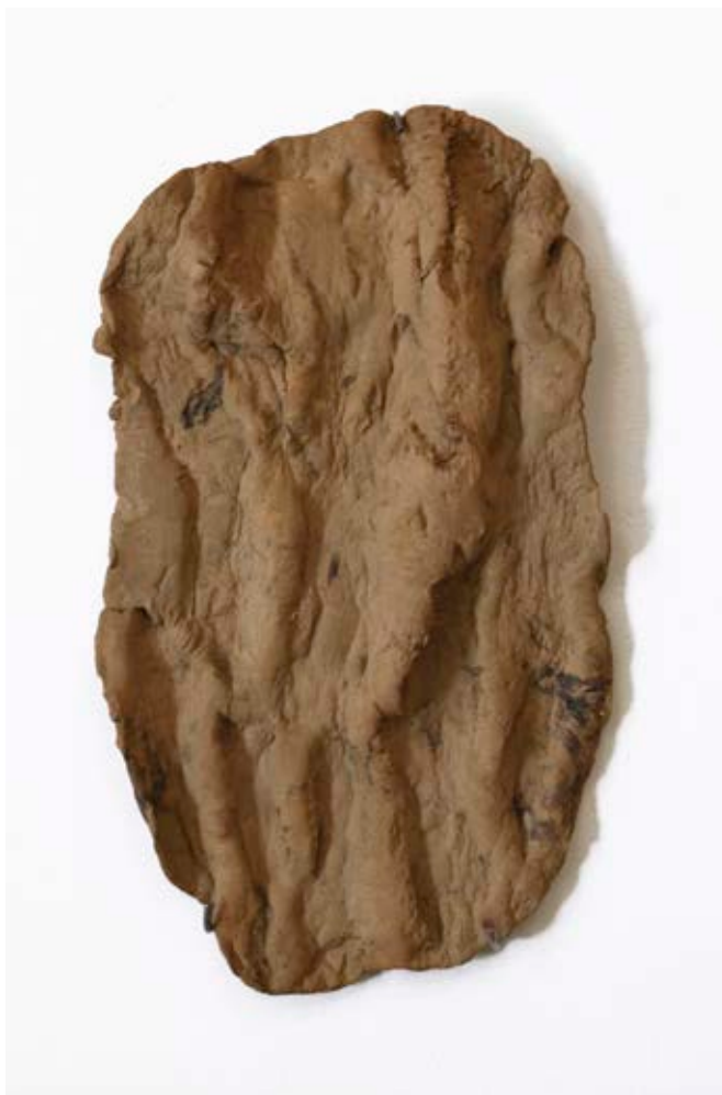
Escorces E2. Fang refractari de colors beix, vermell i negre cuit a alta temperatura. 50 x 32 cm.