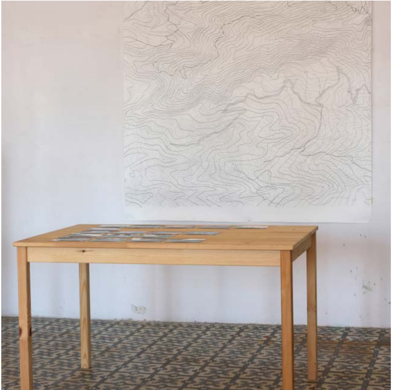
En el bosc. Dibuix de la sèrie estrats i fotografies, noms i coordenades sobre taula de pi. 220 x 150 x 170 cm. aprox.