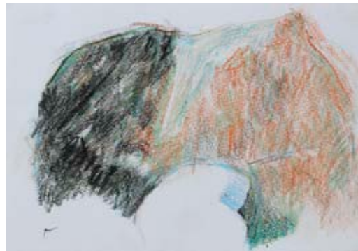
Registres. Pastel gras i grafit sobre paper. 14,5 x 21 cm. cada un.