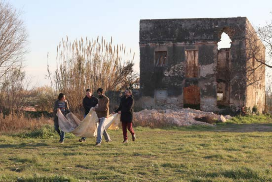
Projecte Retornar. Acció realitzada el 29 de gener de 2017 a La Canonja.