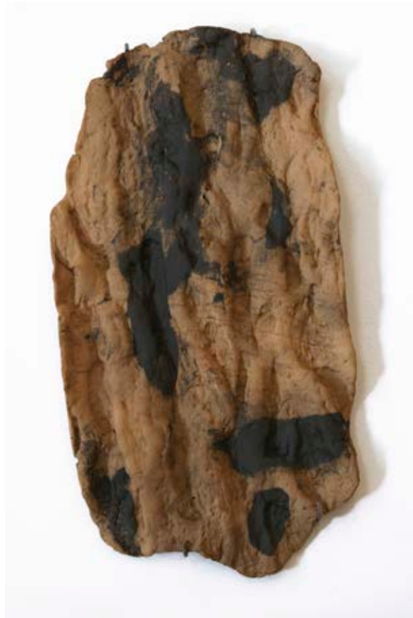
Escorces E4. Fang refractari de colors beix, vermell i negre cuit a alta temperatura. 65 x 35 cm. Ceràmica procedent de l'extracció de l'empremta d'un pi situat enmig del bosc.