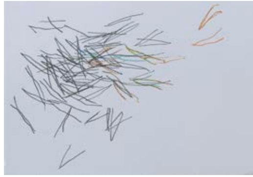
Registres. Pastel gras i grafit sobre paper. 14,5 x 21 cm. cada un.