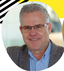
Pere Granados Alcalde de Salou