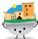
Colla Casc Antic