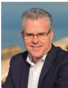
Pere Granados Carrillo Alcalde de Salou