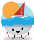
Colla Escola Elisabeth