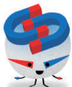
Colla Connecta't Jove