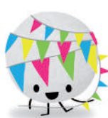
Colla Grup d'Amics de la Festa