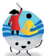
Colla Grup Esplai Salou