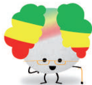
Colla Grup No Tant Jove