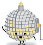
Colla Els Dimecres