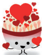
Colla AMPA Escola Vora Mar