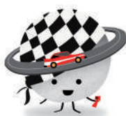
Colla Slot Salou