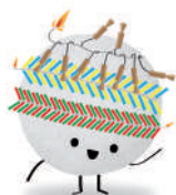
Colla La Traca