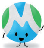
Colla Jove Masia Tous