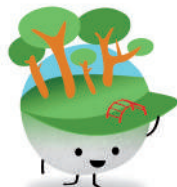
Colla AMPA Escola Salou