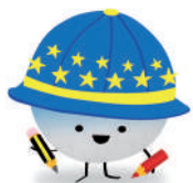
Colla AMPA Escola Europa