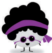
Colla Grup Jove