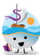
Colla AMPA Escola Santa Maria del Mar