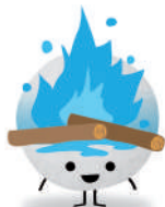
Colla Los Imposibles