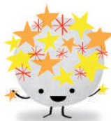
Colla Molta Festa