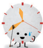
Colla Las Prisas