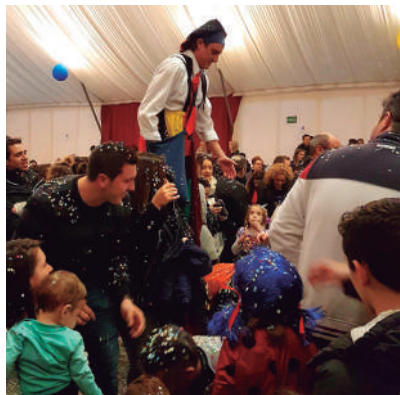
Festa Major de Salou

Amb l'actuació de la Cremallera. Torna la pluja de confetti al Cós Blanc Xic'S. La Confetina i el Rocky, ens faran ballar i gaudir d'aquesta festa familiar per als més petits. Aforament limitat.