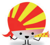
Colla La Gresca