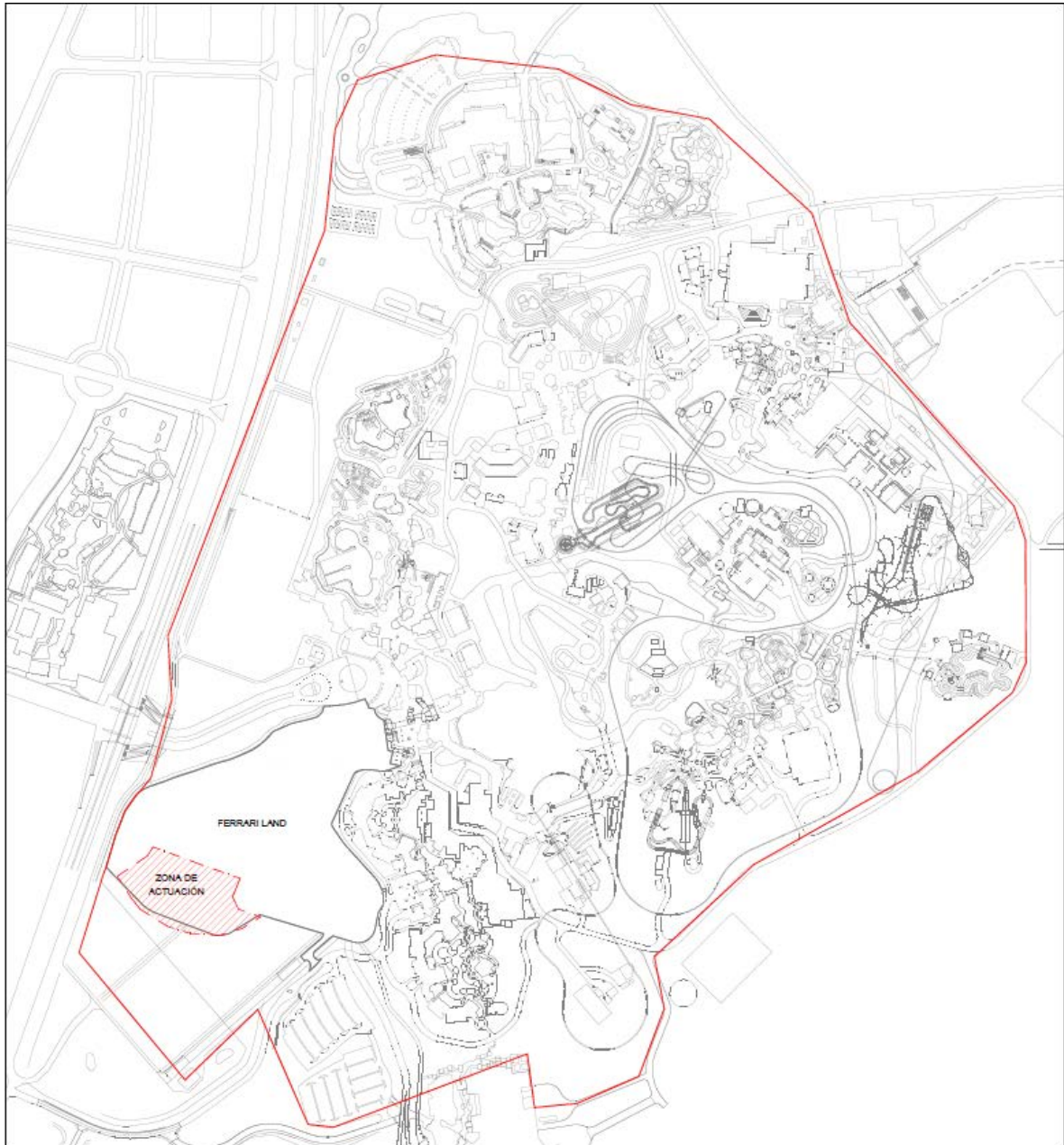
Detall de la zona d'actuació dins el Parc Temàtic.

La modificació que es pretén dur a terme és la següent: