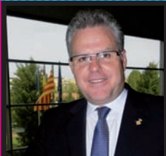
Pere Granados Carrillo Alcalde de Salou