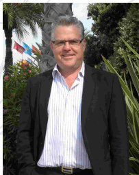
Pere Granados Alcalde de Salou