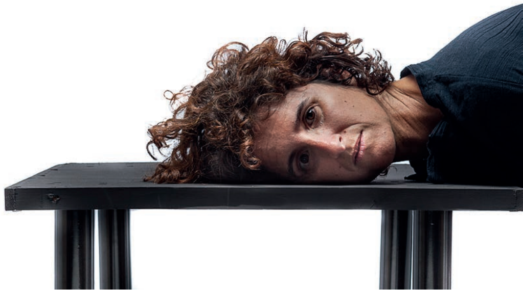
Nela Serie "El olvido del yo" 32/44. Técnica mixta. 21x20 cm 2017 Fotografía impresa en papel acetato sobre cartulina blanca e imanes de neodimio.