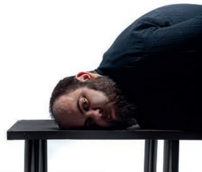
Miguel. Serie "El olvido del yo" 35/44. Técnica mixta. 21x20 cm 2017 Fotografía impresa en papel acetato sobre cartulina blanca e imanes de neodimio.