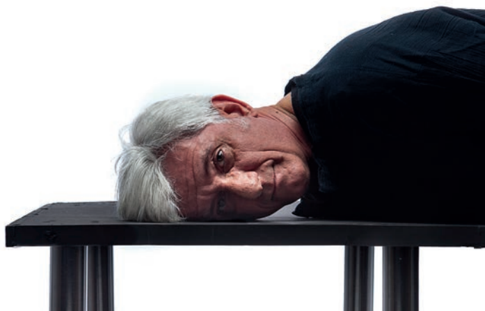
Juanjo. Serie "El olvido del yo" 39/44. Técnica mixta. 21x20 cm 2017 Fotografía impresa en papel acetato sobre cartulina blanca e imanes de neodimio.