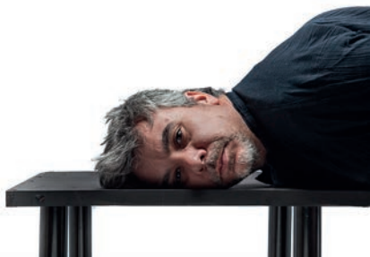
Jose Luis. Serie "El olvido del yo" 33/44. Técnica mixta. 21x20 cm 2017 Fotografía impresa en papel acetato sobre cartulina blanca e imanes de neodimio.