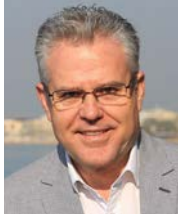
Pere Granados Carrillo Alcalde de Salou