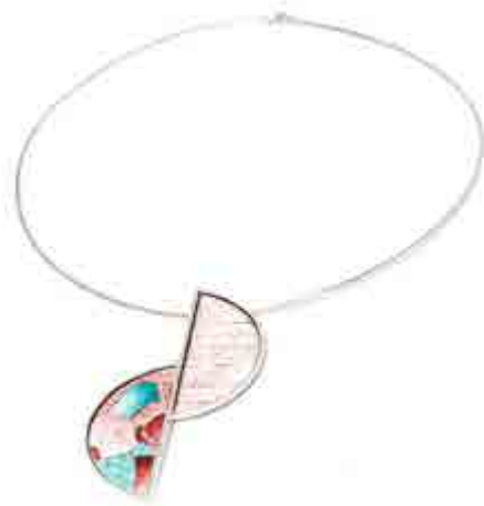
Àngels SANZ S-485 Vinaròs, Castelló