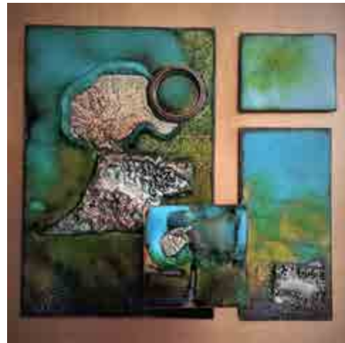
Montserrat RIFÀ S-220 Barcelona