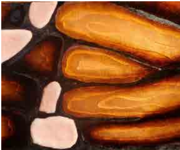
Ester COLL S-180 Barcelona