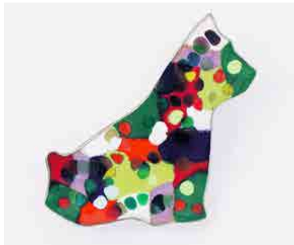
Berta BELZA S-536 Castelldefels, Barcelona