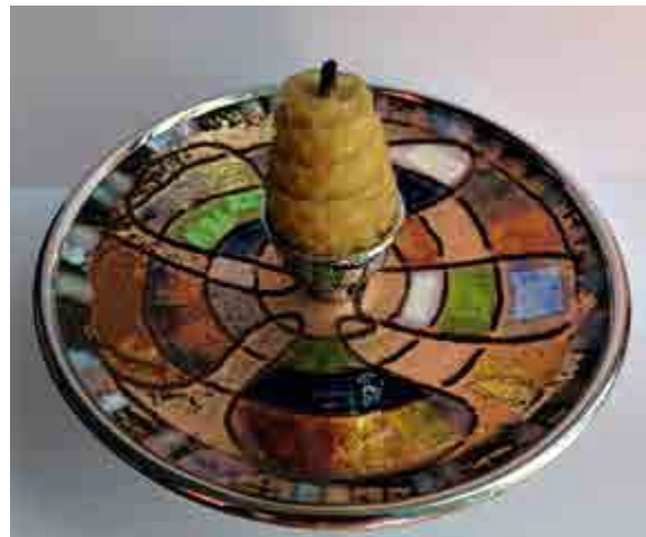
Consol MARCÓ S-179 Valldoreix, Barcelona