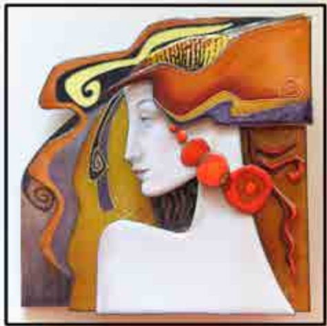
Ma. Isabel FELIU S-56 Calella, Barcelona