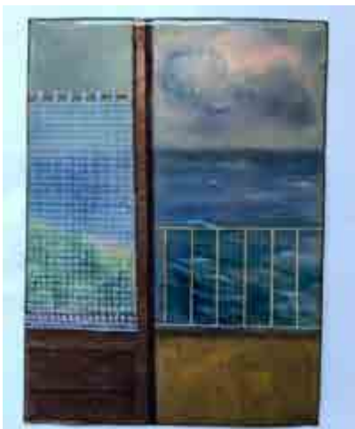
Carme BRUNET S-102 Barcelona