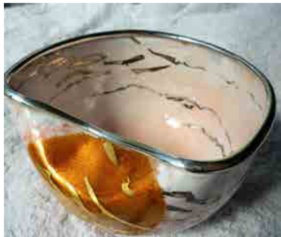
Mercè RABETLLAT S-387 Barcelona