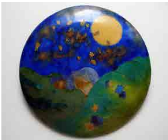
Carme CARRANZA S-427 Sitges, Barcelona