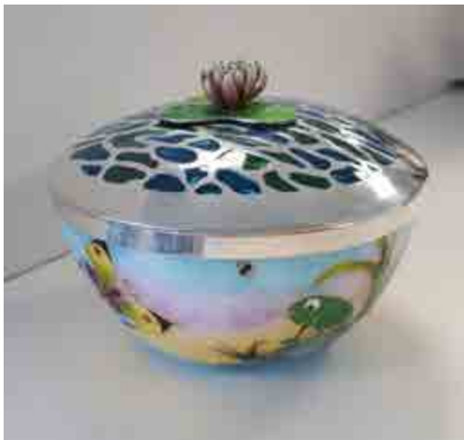
Yolanda LEÓN S-488 Barcelona