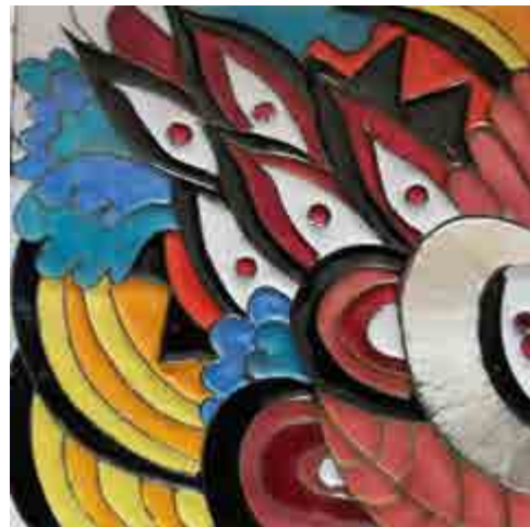
Antoni BACHS S-551 Premià de Mar, Barcelona