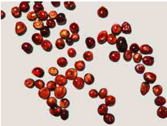
"Magrana" de Virginia Escudero.