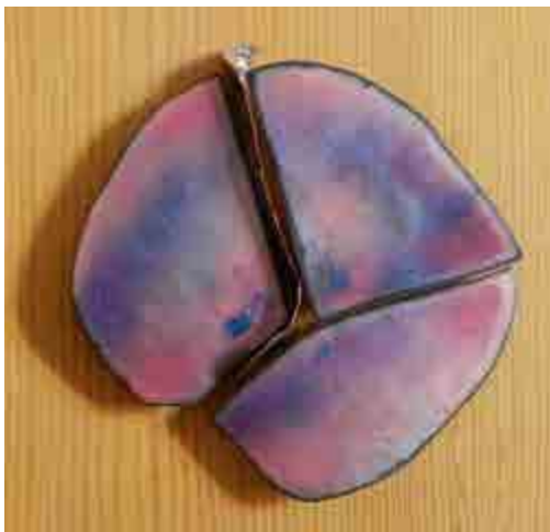
Maria ELBA S-44 Barcelona