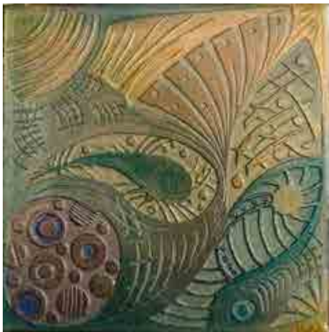
Montserrat AGUASCA S-549 Barcelona