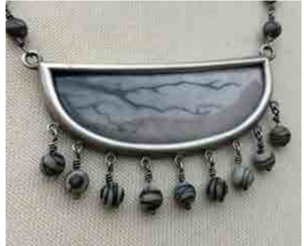
Mer ALMAGRO S-595 Kessel-lo, Bèlgica