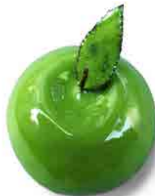
"Poma" de Nicolay Serrano