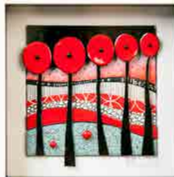
Txus FIBLA S-590 Alcanar, Tarragona