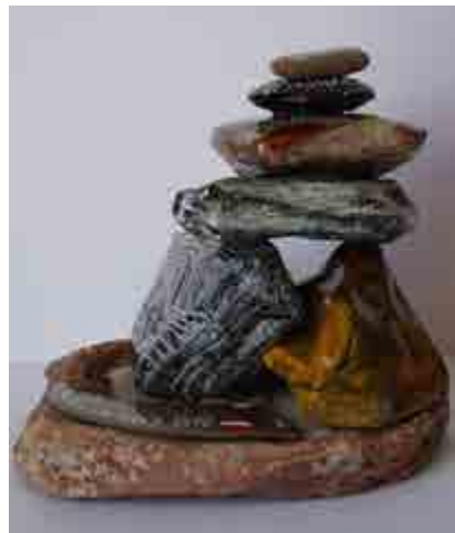
Pilar TELLO S-359 Sitges, Barcelona