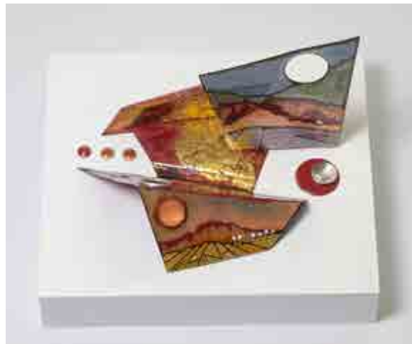
Tatiana CANO S-569 Granada