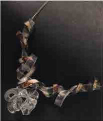
Júlia ARES S-92 A Coruña