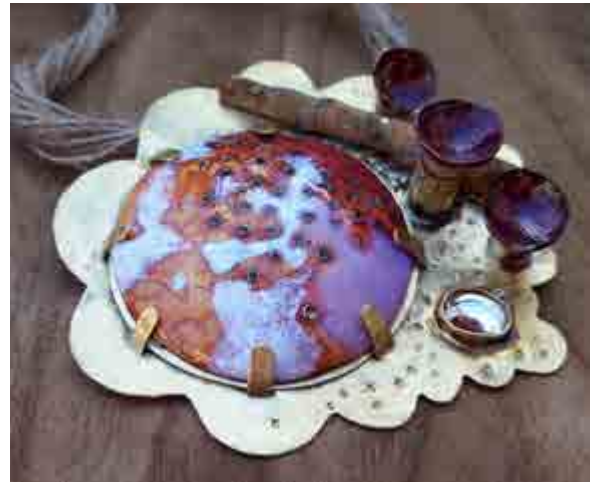
Rosalia POMÉS S-486 Valls, Tarragona