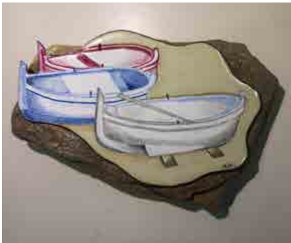
Angels RUIZ-ALPISTE S-331 Barcelona