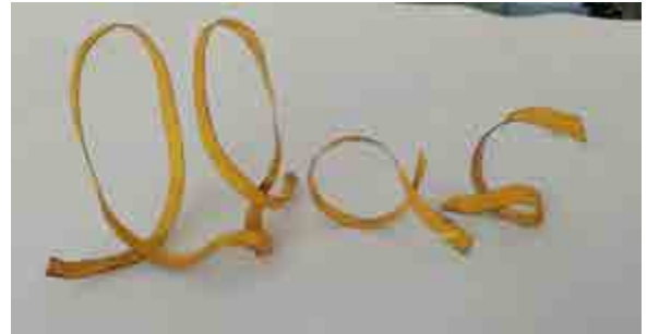
Cristina RIAMBAU S-261 Torredembarra, Tarragona