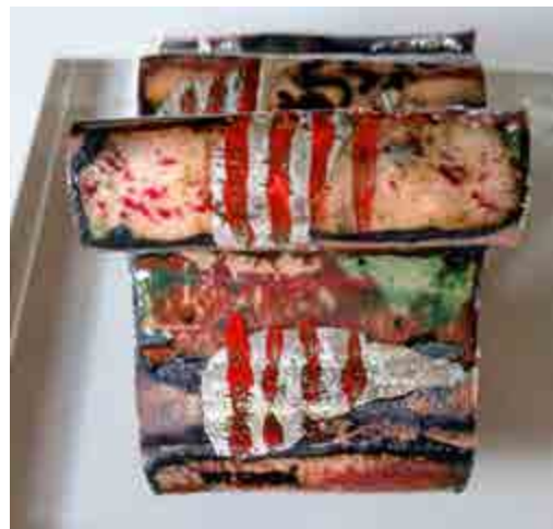
Maria Rosa SARDÀ S-22 Barcelona