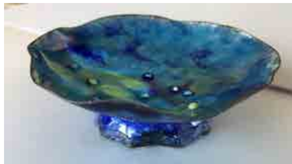
Montserrat CORTINAS S-576 Barcelona