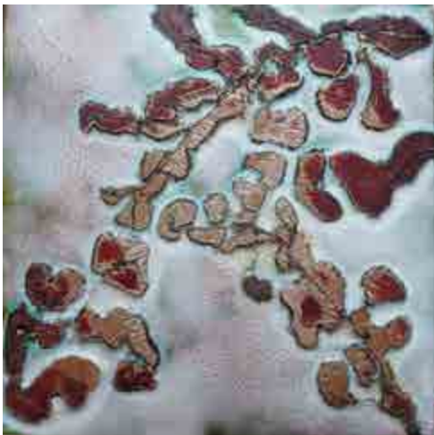
Betlem VEGARA S-567 Barcelona